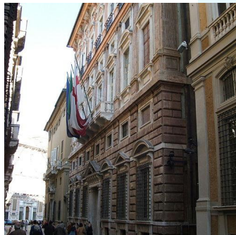
Palazzo Pallavicino (UNESCO)