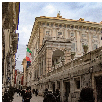
Palazzo Doria - Tursi (UNESCO)