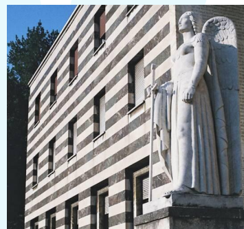
Casa del Mutilato - Fondazione A.N.M.I.G.