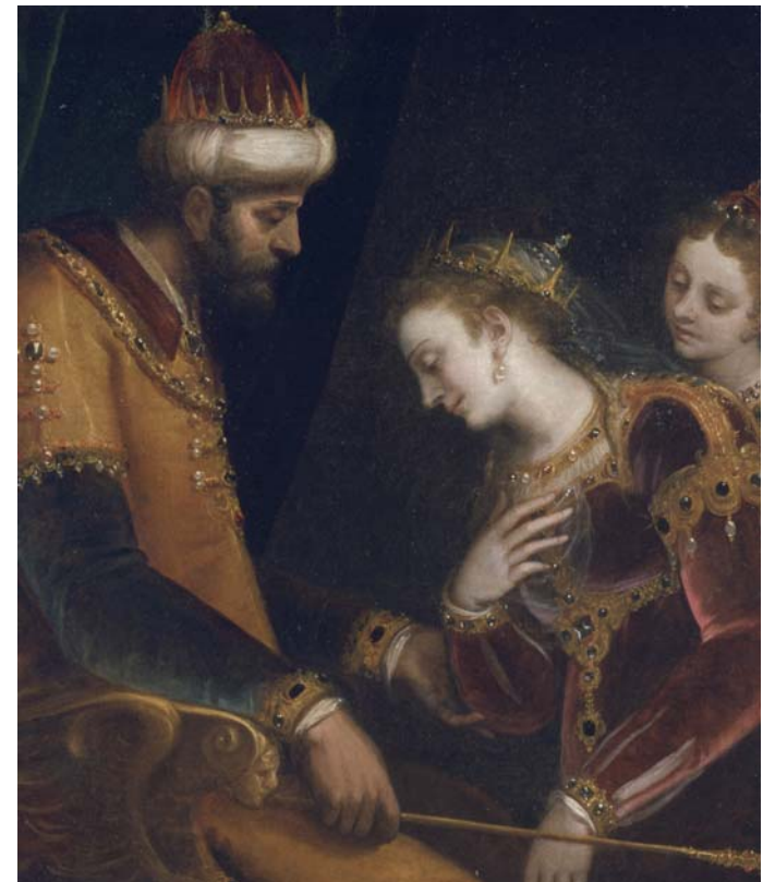
Luca Cambiaso - Esther e Assuero - Austin, Blanton Museum of Art

sequenza di sezioni che ripercorrono cronologicamente l'esperienza pittorica di Luca Cambiaso. A partire dal contesto degli anni Trenta del Cinquecento con la presenza dell'insegnamento dei grandi maestri, l'attenzione punta sempre più sullo specifico della vivace sperimentazione