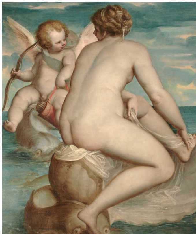
Luca Cambiaso - Venere e Amore sul mare - Roma, Galleria Borghese

Contemporaneamente al rivelarsi dell'attività dell'artista, Genova vive un momento di formidabile sviluppo del suo ruolo economico e politico, inserita in un circuito che lega i grandi centri del potere europeo. Cambiaso opera proprio in quel momento di eccezionale protagonismo della città, agli inizi della stagione nella quale l'aristocrazia genovese vuole e riesce a mostrare il ruolo internazionale raggiunto: lo testimoniano l'eccezionale sviluppo edilizio con la diffusione di una originale tipologia di ville e palazzi, recentemente riconosciuti dall'UNESCO con l'iscrizione nella Lista del Patrimonio Mondiale del sito "Genova: le Strade Nuove e il sistema dei Palazzi dei Rolli", e la coeva necessità di esprimere una grande decorazione che attraverso iconografie appropriate