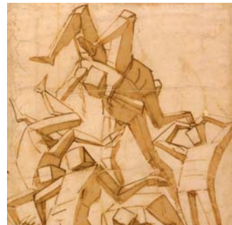
Luca Cambiaso - Studi di figure Firenze, Galleria degli Uffizi

dichiarasse la 'virtù' della classe dominante. Due sedi ospitano la mostra, Palazzo Ducale e i Musei di Strada Nuova - Palazzo Rosso: i circa duecento oggetti tra dipinti, disegni, sculture, arazzi e miniature, provengono da musei di tutto il mondo, fra cui le Gallerie fiorentine, la Pinacoteca di Brera di Milano, la Galleria Sabauda di Torino, il Polo Museale romano, il British Museum, il Louvre, l'Albertina di Vienna, la National Gallery di Edimburgo, il Blanton Museum di Austin, la Gemäldegalerie di Berlino, il New Orleans Museum of Art, il Princeton University Art Museum, il Museo del Prado, il Monastero Reale di San Lorenzo dell'Escorial. A Palazzo Ducale, lo spazio espositivo è articolato in una