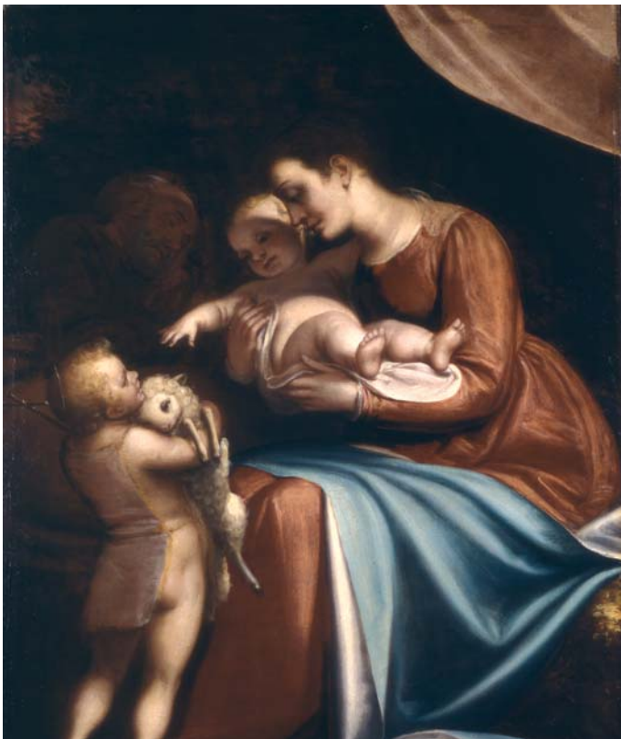
Luca Cambiaso - Sacra Famiglia con San Giovanni Edimburgo, National Gallery of Scotland

Luca Cambiaso, è senza dubbio l'artista ligure internazionalmente più noto, grazie alla complessità della sua esperienza artistica, alla sua qualità di disegnatore e soprattutto alla sua opera all'Escorial che ne conferma la notorietà nel panorama del tardo Cinquecento europeo. Il carattere di esemplarità del pittore ligure nel suo rapporto con i grandi maestri del Cinquecento e la sua dimensione europea, sono i presupposti di questa importante iniziativa espositiva che, a distanza di 50 anni dell'ultima mostra monografica, offre al pubblico una ampia selezione di opere che rivelano in modo completo le scelte del pittore e che permettono di seguirne l'itinerario artistico dall'esperienza giovanile fino all'attività per la corte spagnola.